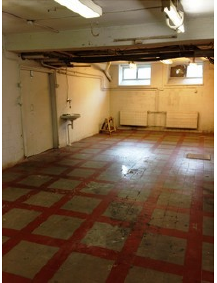
Kankurintie 14, 08500 Lohja